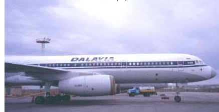
Новейший самолет ДальАвиа – Ту 214